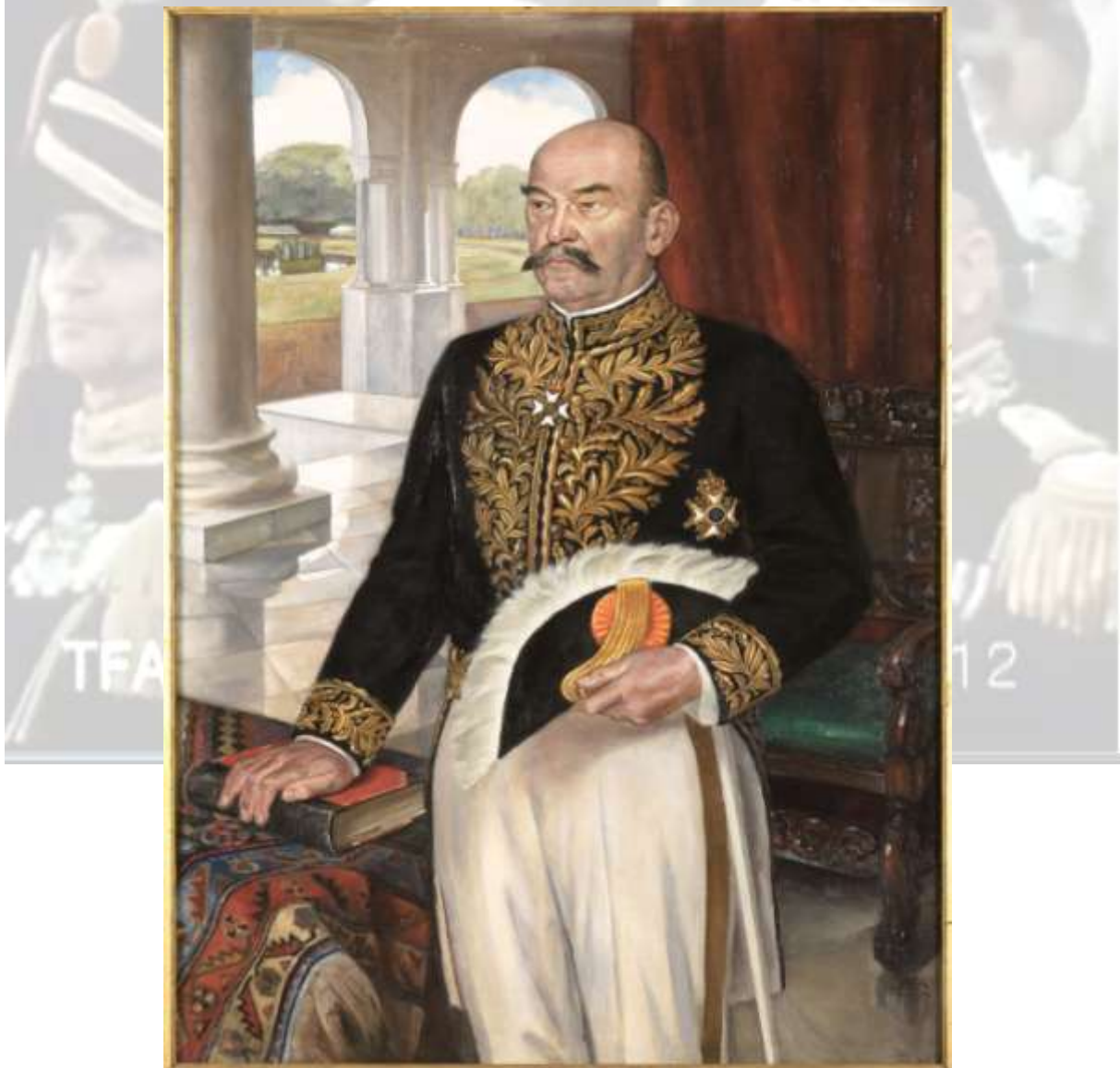
Gouverneur generaal D.Fock 1921-1926 met klapsteek

De Gouverneur Generaal representeerde het hoogste gezag in Nederlands indie en werd ook wel de onderkoning van Indie genoemd. De steek die door de GG's werd gedragen is van algemeen model met witte veren een vergulde W knoop en een lis van zes strengen. Zowel steken van vol model als ook klap steken komen voor.