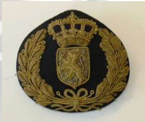
Petembleem Model 1925.

Een zwart zijden galon ter breedte van 3 centimeter, rondom den bol; een in het midden der voorzijde van den bol, op een los stuk zwart laken in gouddraad geborduurd embleem, bestaande uit het Rijkswapen (de leeuw te borduren op een stuk Nassaublauw laken), gedekt door de Koninklijke kroon.