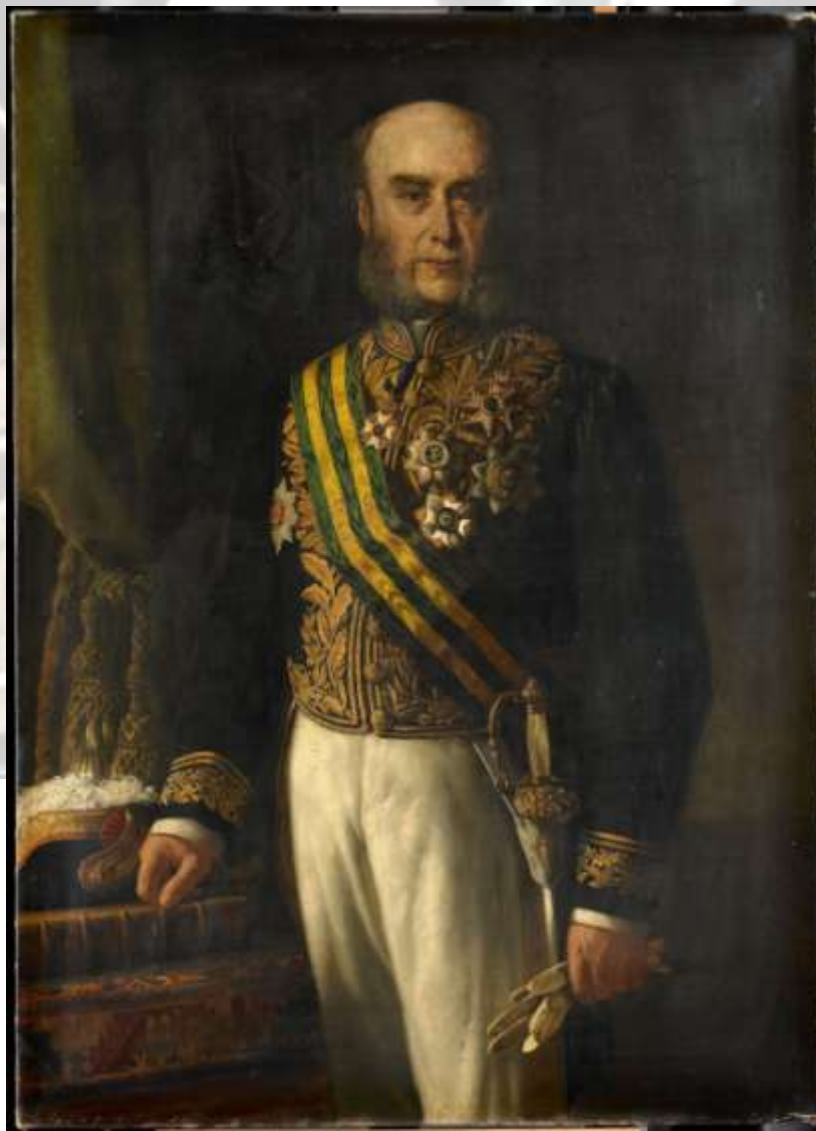
Gouverneur generaal Loudon 1871-1875 met de steek van het tussenmodel

Vanaf 1871 zien we de steek voor de gouverneurs generaal nog fraaier worden zonder dat hier een koninklijk besluit aan ten grondslag lag. De steek werd aan de rand versierd met een gouden galon met rode rand. De eerste die dit deed was de Gouverneur generaal Loudon en zijn opvolger gouverneur generaal van Lansberge nam ook die gewoonte over. Dit alles geschiedde tussen 1871 en 1880. Hierna zien we de normale steek voor de gouverneur generaal weer terugkeren.