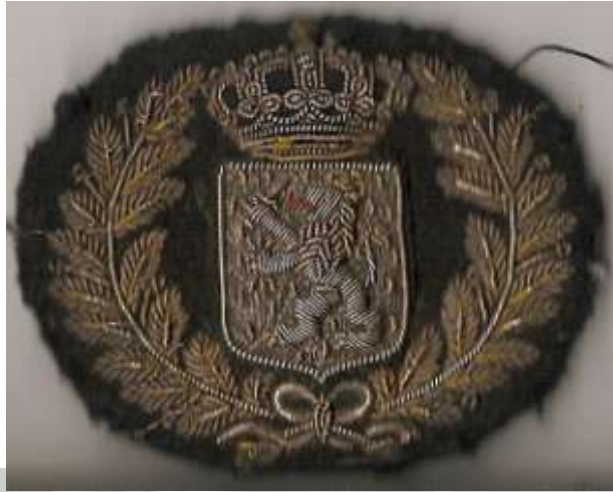
Petemblem model 1904/1908