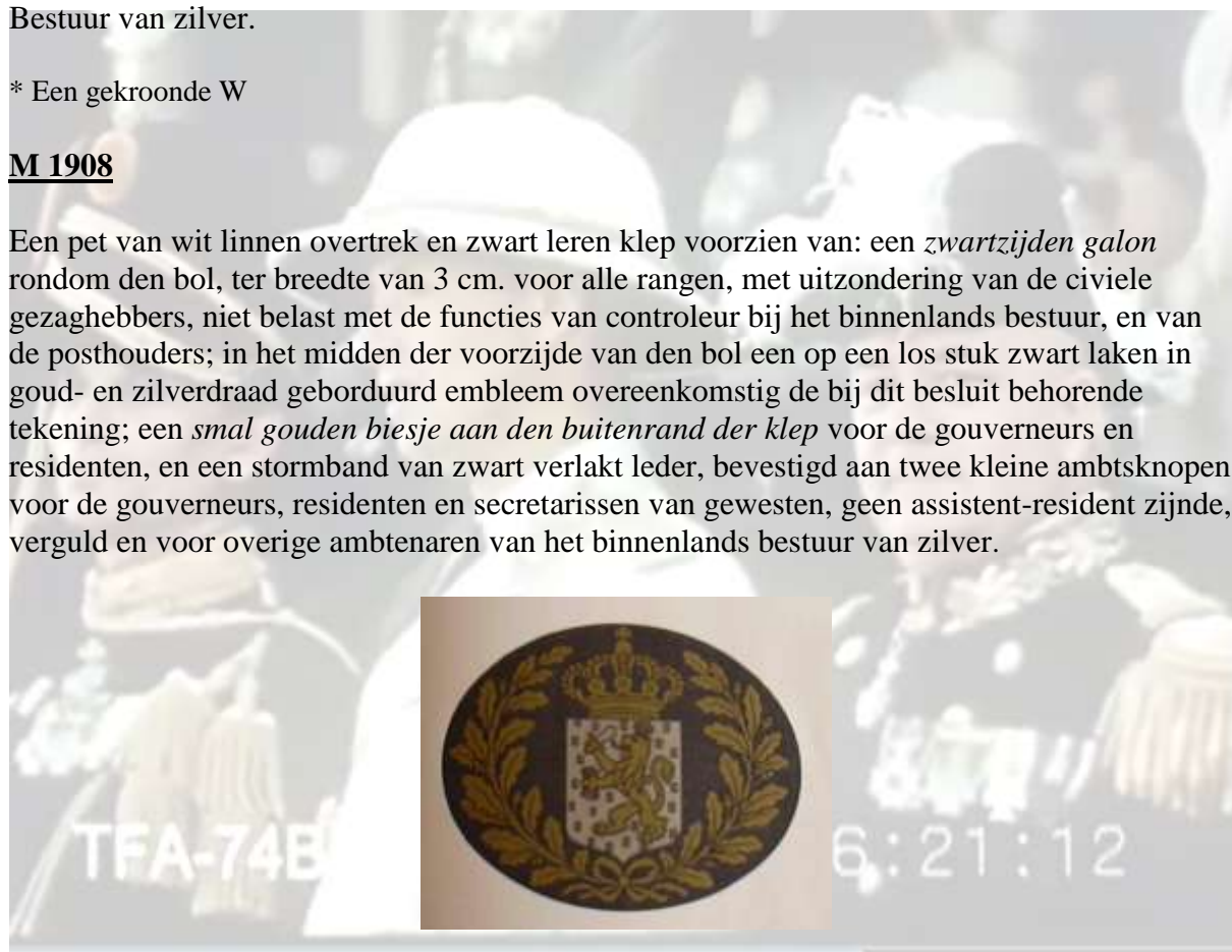
Pet embleem M1908

Een pet van wit linnen overtrek en zwart leren klep voorzien van: een zwartzijden galon rondom den bol, ter breedte van 3 cm. voor alle rangen, met uitzondering van de civiele gezaghebbers, niet belast met de functies van controleur bij het binnenlands bestuur, en van de posthouders; in het midden der voorzijde van den bol een op een los stuk zwart laken in goud- en zilverdraad geborduurd embleem overeenkomstig de bij dit besluit behorende tekening; een smal gouden biesje aan den buitenrand der klep voor de gouverneurs en residenten, en een stormband van zwart verlakt leder, bevestigd aan twee kleine ambtsknopen, voor de gouverneurs, residenten en secretarissen van gewesten, geen assistent-resident zijnde, verguld en voor overige ambtenaren van het binnenlands bestuur van zilver.