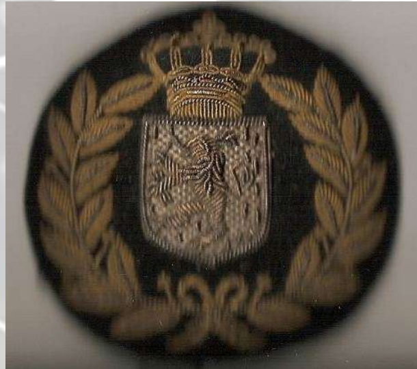
Petemblem model 1925