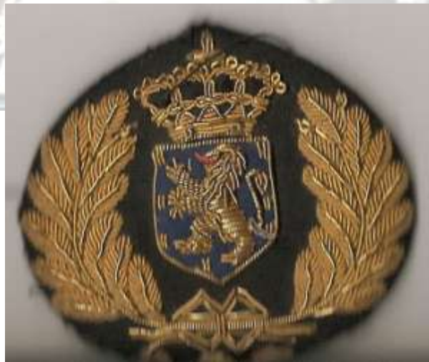
Petemblem model 1929