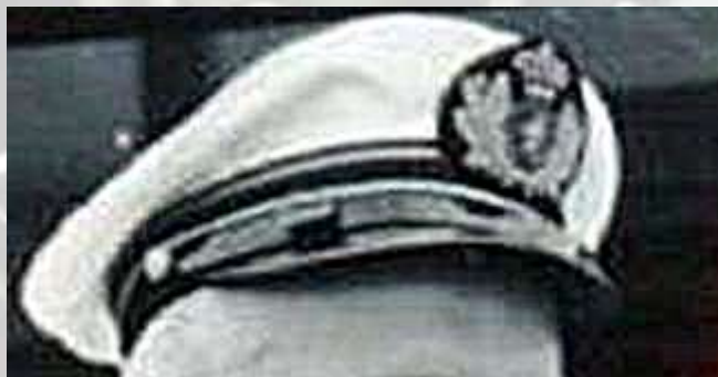
Pet model 1932 voor burgemeesters

c. van een stormband geheel van zwart leder, breed 12 mm, welke bevestigd wordt door twee op de zijde geplaatste kleine, platte, vergulde ambtsknopen. De pet kan naar verkiezing versierd worden met een embleem als onder C I.