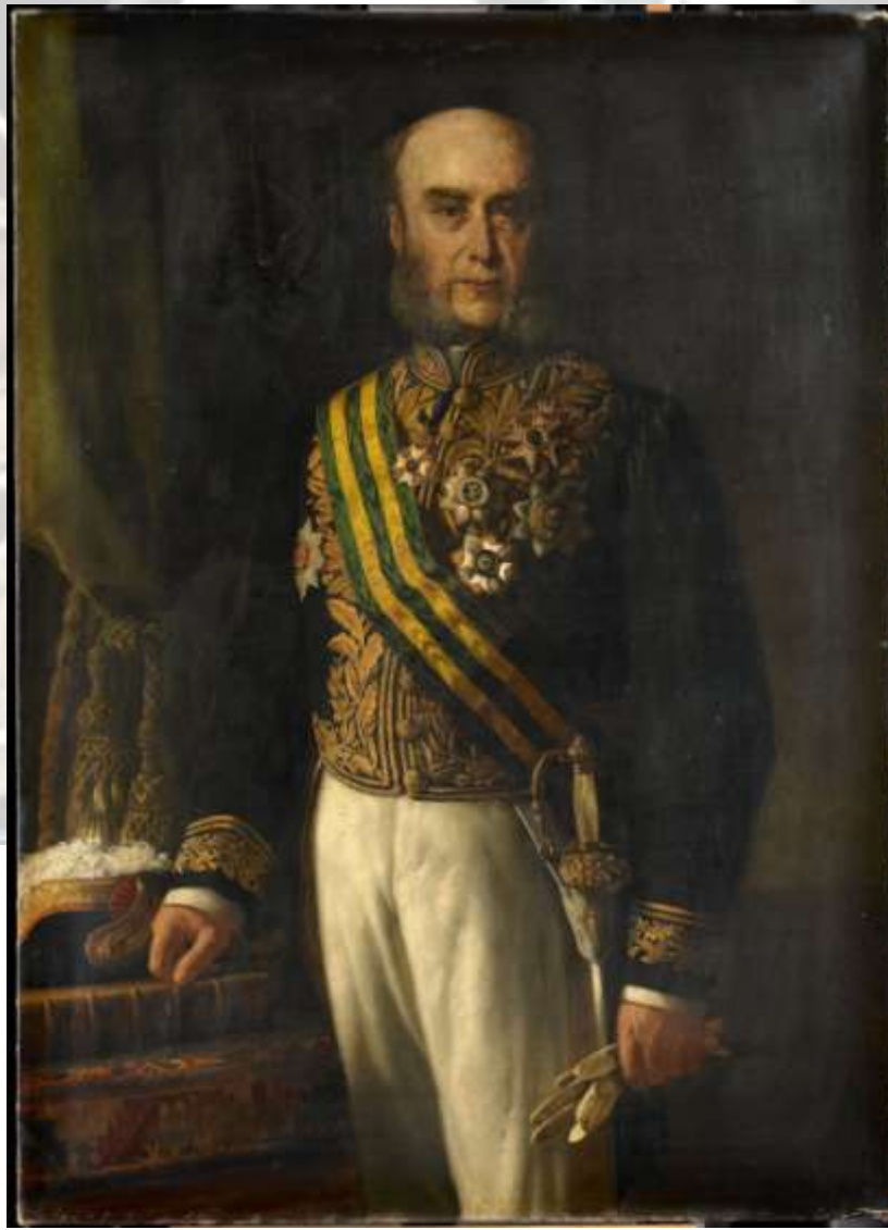
Gouverneur generaal Loudon 1871-1875 met de steek van het tussenmodel

Vanaf 1871 zien we de steek voor de gouverneurs generaal nog fraaier worden zonder dat hier een koninklijk besluit aan ten grondslag lag. De steek werd aan de rand versierd met een gouden galon met rode rand. De eerste die dit deed was de Gouverneur generaal Loudon en zijn opvolger gouverneur generaal van Lansberge nam ook die gewoonte over. Dit alles geschiedde tussen 1871 en 1880. Hierna zien we de normale steek voor de gouverneur generaal weer terugkeren.