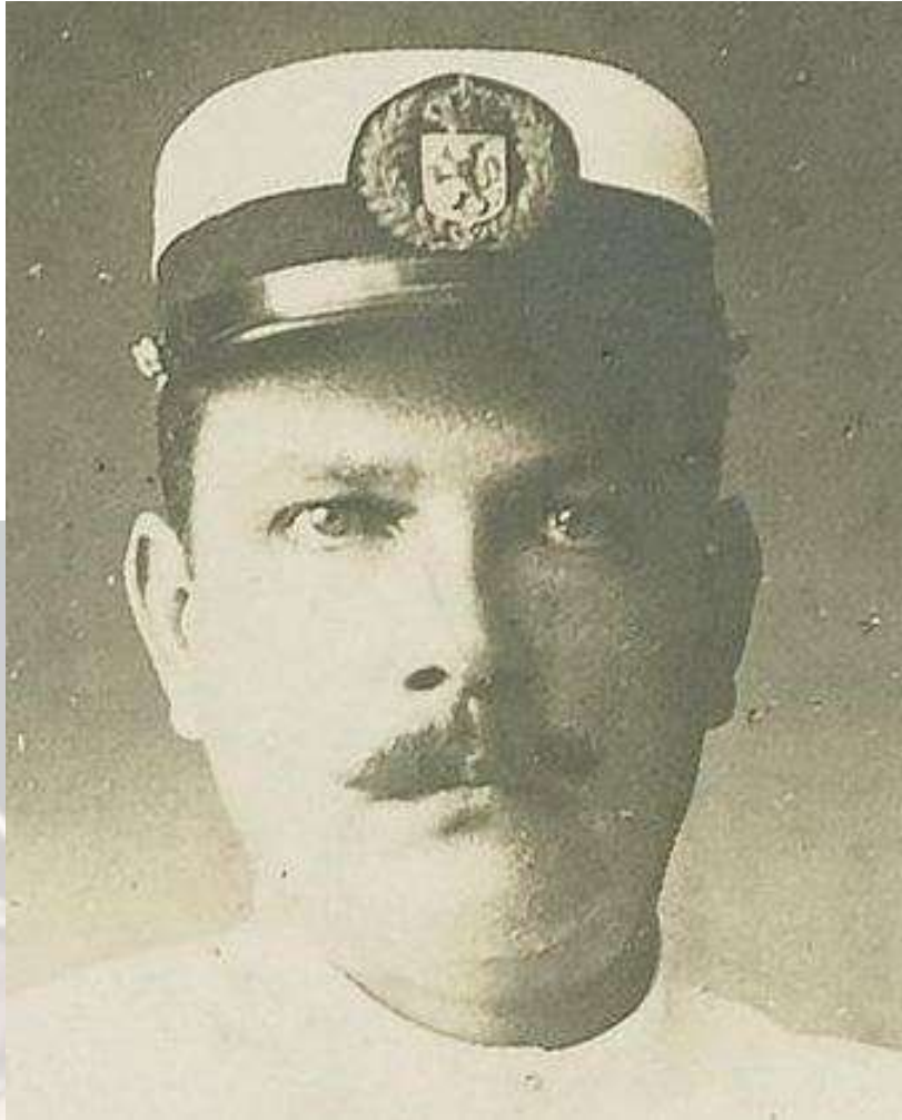
Ambtenaar van het binnenlands bestuur met pet model 1908